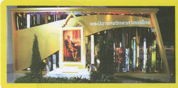
นิทรรศการเทิดพระเกียรติ พระบิดาแห่งวิทยาศาสตร์ไทย