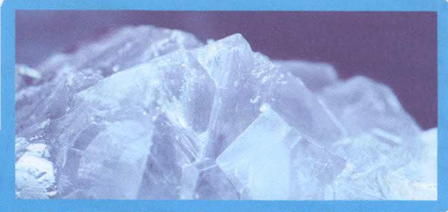
มหัศจรรย์แห่งพลิก