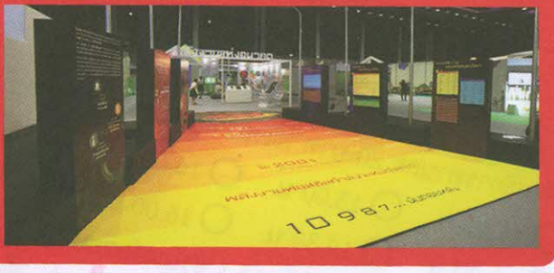
พลังงานแห่งอนาคต