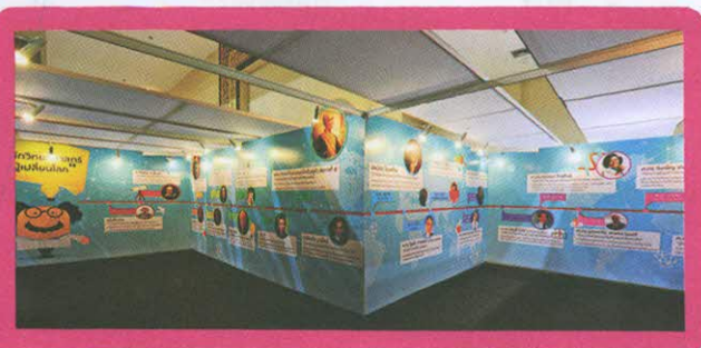
Science Idol “เส้นทางนักวิทยาศาสตร์”

พบกับเดือนตุลาคมนี้ เป็นต้นไป... ณ จัตุรัสวิทยาศาสตร์ อพวช. ชั้น 4 อาคารจัตุรัสจามจุรี สาขานนทบุรี