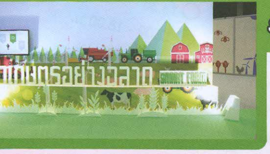
Smart Farming “เกษตรอัจฉริยะ”