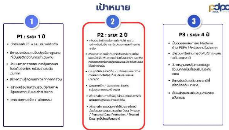
ภาพที่ ๒ ระยะตามแผนแม่บทการส่งเสริมและการคุ้มครองข้อมูลส่วนบุคคลของประเทศ พ.ศ. ๒๕๖๗ - ๒๕๗๐

สำนักงานคณะกรรมการคุ้มครองข้อมูลส่วนบุคคล ได้ดำเนินงานตามแผนการขับเคลื่อนภายใต้แผนแม่บทการส่งเสริมและการคุ้มครองข้อมูลส่วนบุคคลของประเทศ พ.ศ. ๒๕๖๗ - ๒๕๗๐ เป้าหมายระยะที่ ๒ ซึ่งมุ่งเน้นการดำเนินงาน ๖ เป้าหมาย ประกอบด้วย